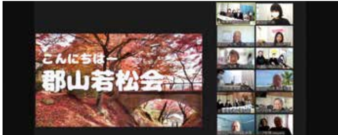
オンライン交流会(大阪府交野市シニア松塚と交流) 山形県 南陽市郡山若松会

スマートフォンやインターネット、ケーブルテレビの活用、現代の社会課題に応じた貢献活動(フードバンク)など、新しい視野による取り組みも広がりました。一方で、アンケートや電話相談など、会員ひとり一人を大切にしようとした活動も行われました。老人クラブのこれからにつながる取り組みです。