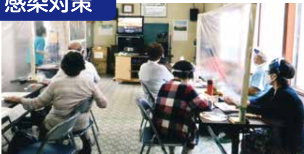
手作りの感染防止パネル