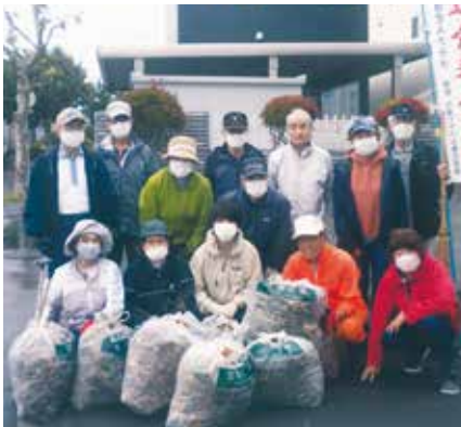
北海道 江別市大麻扇町遊友クラブ