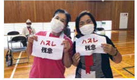
コロナ禍の運動会 大好評で今年も開催。