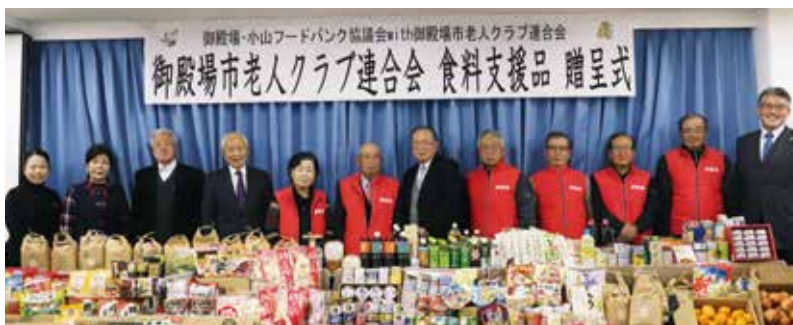
未使用の食糧を集めてフードバンクに寄贈 静岡県 御殿場市老人クラブ連合会