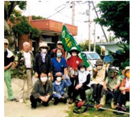
沖縄県 浦添市上野ゆかり会