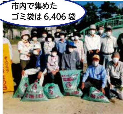
名古屋市 南区星崎北・南・東部喜楽会