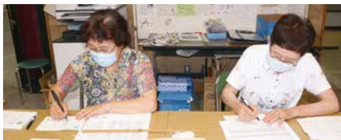
ハガキで会員にアンケート 山梨県 笛吹市シニアクラブ連合会