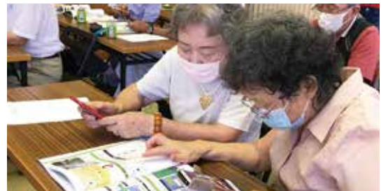
スマホ講習会 神奈川県 藤沢市片瀬地区老人クラブ連合会