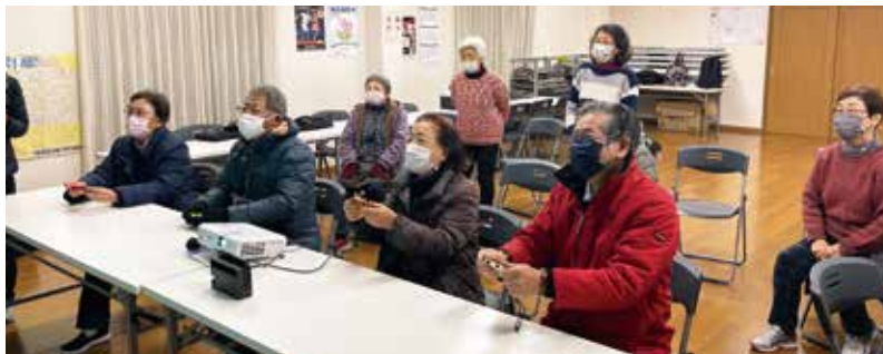
eスポーツ体験 千葉県 中央区村田町福寿会