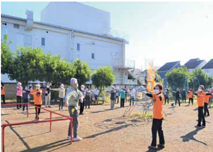
毎週木曜日の体操会 介護予防はあなたが主役