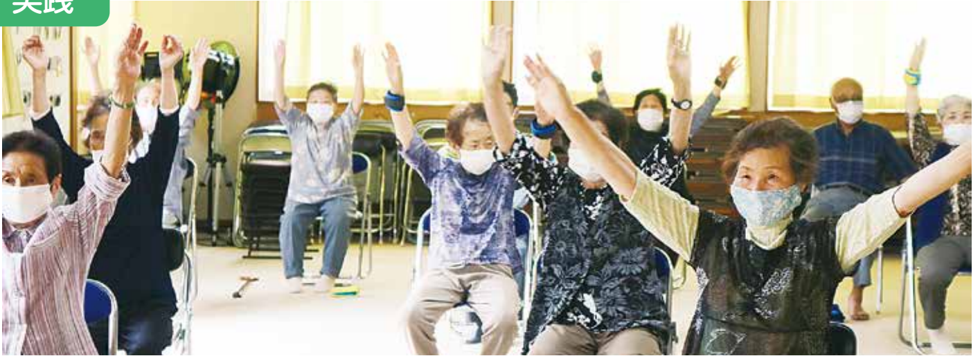
週2回の生き生き百歳体操 会員の強い要望で再開！