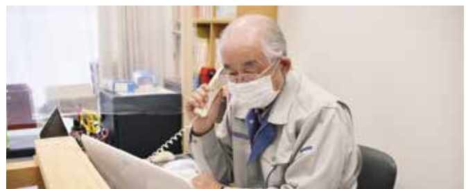
クラブの困りごとを聞く「相談室」を開設 京都府 福知山市老人クラブ連合会