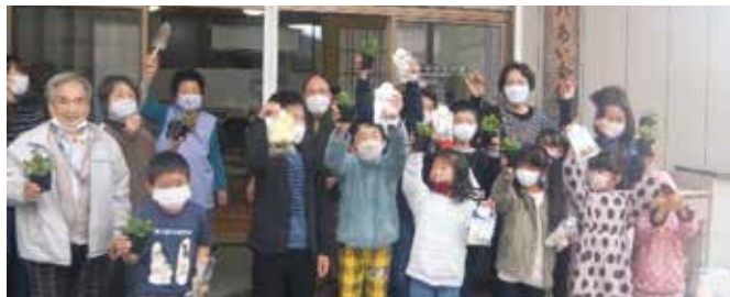
ふれあいカフェ 街づくりを目指して世代交流も企画 福井県 越前市堀川いきいきシニアクラブ