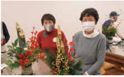
門松作り体験会 希望者多数で大盛況