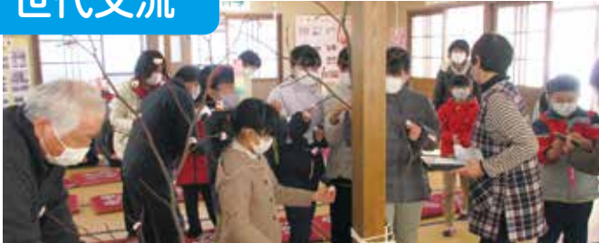
三世代小正月伝承行事 感染防止で団子づくりは省略 岩手県 奥州市田谷和み会