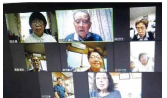
役員会をオンラインで開催 京都市 下京区シルバークラブ連合会七三学区