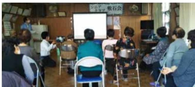
大学生と交流会 感染対策でオンライン開催 長崎県 佐世保市敷石会