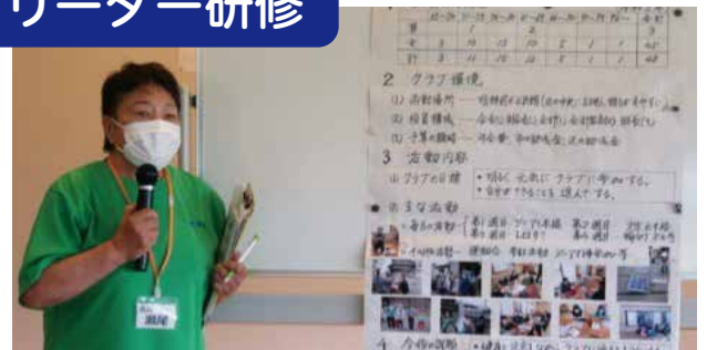
女性部研修会開催