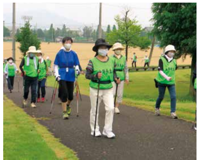
ウォーキングクラブ(毎月1回)