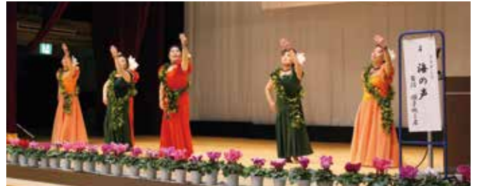
「作品展・発表会」をケーブルテレビで放送 栃木県 茂木町老人クラブ連合会