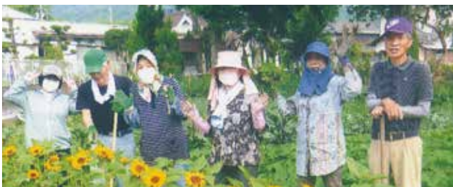
三世代交流農園 目指して開墾中 岡山市 北区西蛸明小学校区大井なかよしクラブ