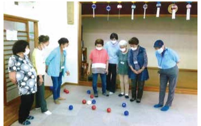
ボッチャは楽しいスポーツ 希望者が集まり月1~2回