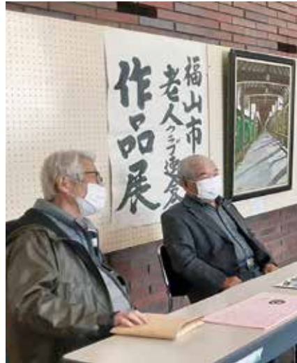
老人クラブ作品展 気分は小さな美術館