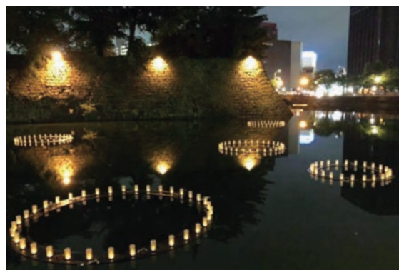
「木曜お堀の会」ブログより

「灯り」づくりは、地元の小学校児童も行い、その際、会員が空襲時にお堀に飛び込んで避難した体験談等話し聞かせて、子供たちに戦争や震災の恐ろしさ、平和の大切さを伝えています。