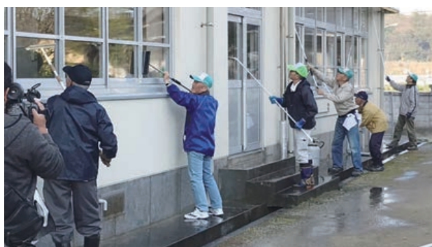
卒業を迎える6年生と一緒に窓ふき清掃