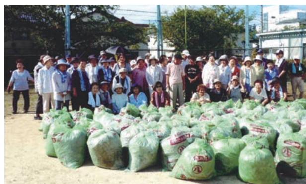
名古屋市守山区吉祥会

守山区吉祥会 グラウンド・ゴルフ活動に利用している1,000㎡のグラウンドに、早朝から72名が参加し、日頃の感謝を込めて皆さん楽しみながら一生懸命に清掃活動を行いました。集めた草や