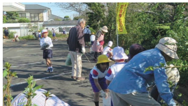
鹿児島県出水市老連

老人週間の期間中、社会奉仕の日の取り組みも含めて、「健康・友愛・奉仕」活動に県内34市町村老連で8万7千人が参加しました。鹿児島県出水市老連では、小学生といっしょに清掃奉仕に取り組みました。