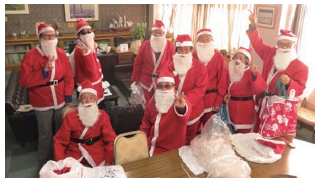
20年続くサンタのクリスマスプレゼント

○入学式や卒業式には、老人クラブが育てたパンジーのプランターを提供し、子どもたちの入退場